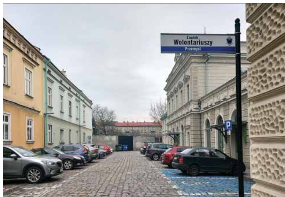
Działający do dziś punkt recepcyjny na dworcu kolejowym w Przemysłu