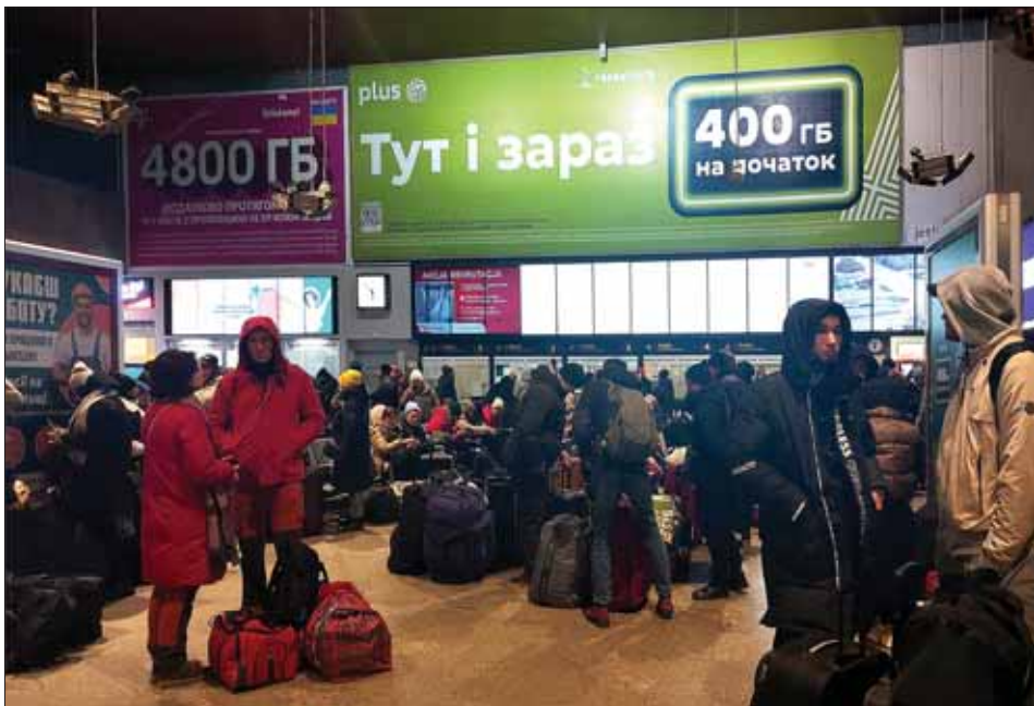
Dworzec Zachodni PKS w Warszawie, zwany „Małą Ukrainą”

Тож, проблема гуманітарної допомоги українським біженцям залишається відкритою. Війна на виснаження, яку веде Росія, потребує шаленої консолідації усіх ресурсів, зокрема й людських. Завдяки