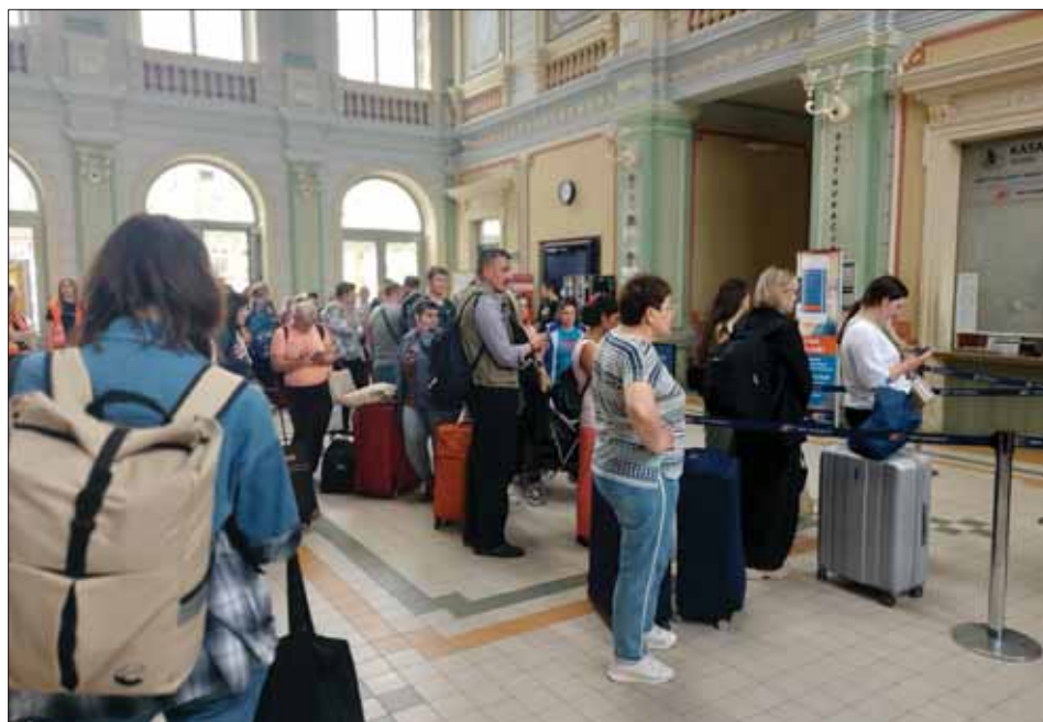
Uchodźcy wojenni w hali dworca kolejowego w Przemyślu pod opieką wolontariuszy