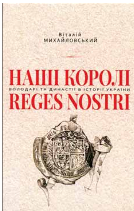
Książka wyróżniona autorstwa Witalija Mychajłowskiego