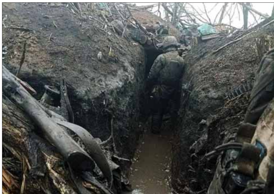
Po bombardowaniu w Słowiańsku