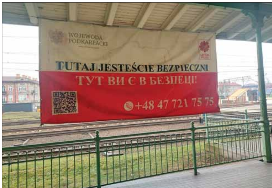
Dworzec kolejowy w Przemyślu. Pierwszy i najważniejszy punkt recepcyjny dla uchodźców