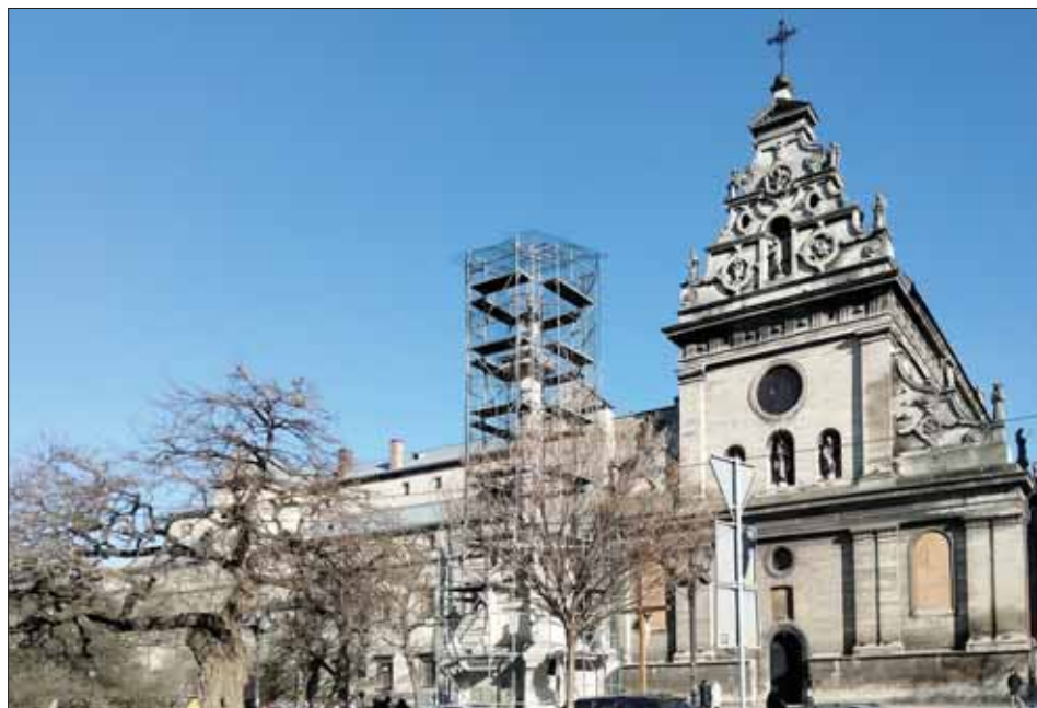
Pomnik greckokatolickiego metropolity lwowskiego abp. Andrzeja Szeptyckiego. W oddali sobór św. Jura